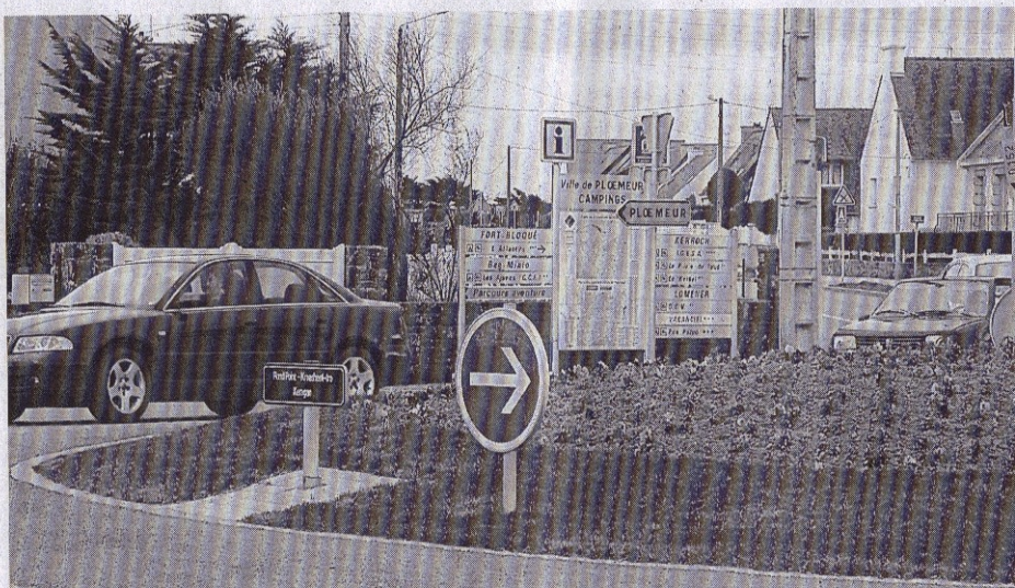
L'AEP suggère de déplacer le panneau d'information installé sur le rond-point de Keragan et qui occasionne selon elle des stationnements dangereux.

Suite à la grosse tempête de 2008, la dune et divers ouvrages d'art ont été abîmés. « Cap l'Orient a supprimé l'escalier endommagé et fait des travaux d'enrochement sur la